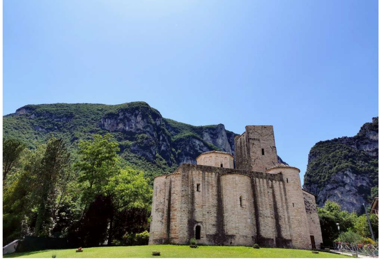
Abbazia San Vittore alle Chiuse